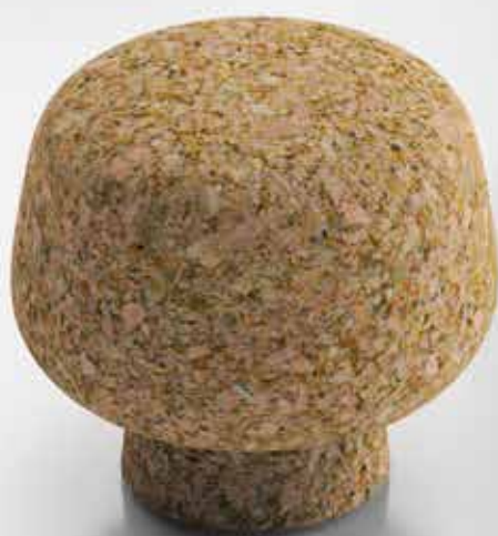
Pebosto Peso S, Pebosto Stop, Pebosto Peso L