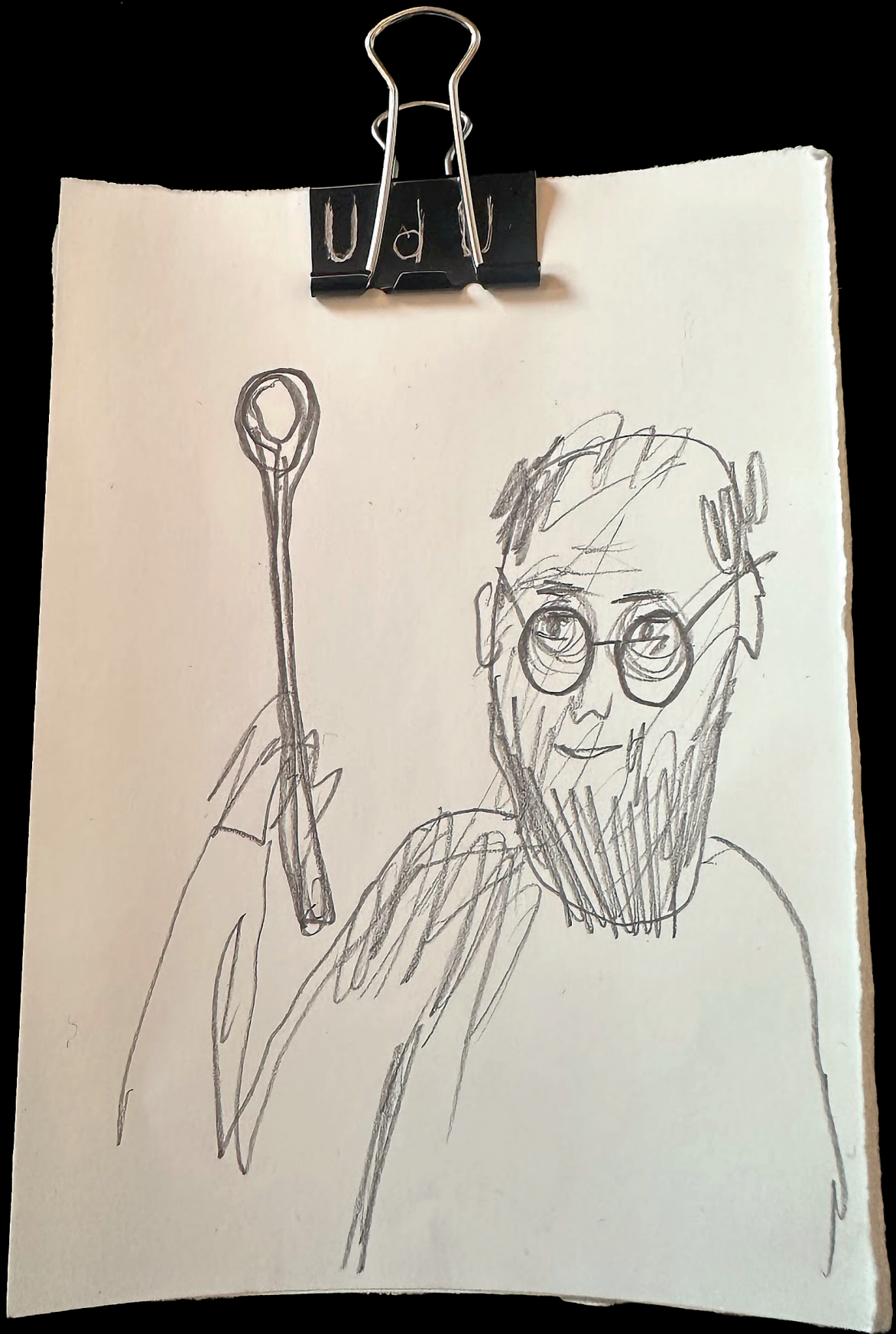
Sketch by Michele De Lucchi