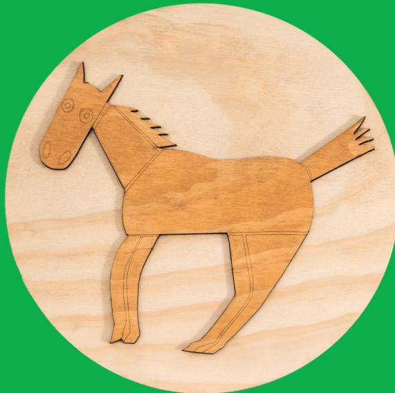
Il cavallo - the horse (Ø360 mm x 11 mm)