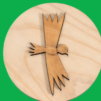
L'uccello - the bird (Ø180 mm x 11 mm)