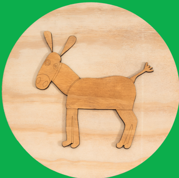
L'Asino - the donkey (Ø360 mm x 11 mm)