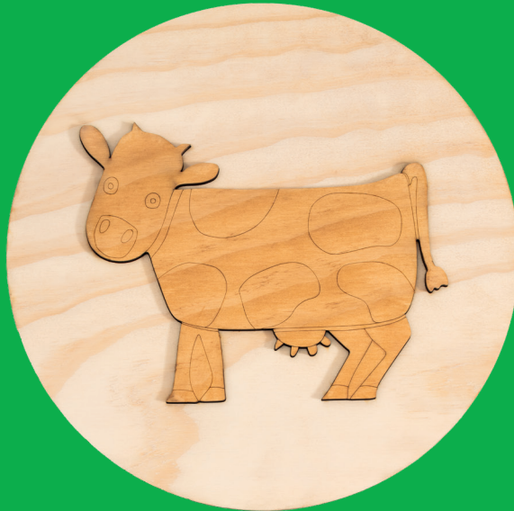
La mucca - the cow (Ø360 mm x 11 mm)