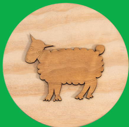
La pecora - the sheep (Ø240 mm x 11 mm)