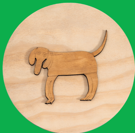
Il cane - the dog (Ø240 mm x 11 mm)