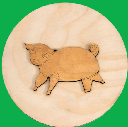
Il maiale - the pig (Ø240 mm x 11 mm)