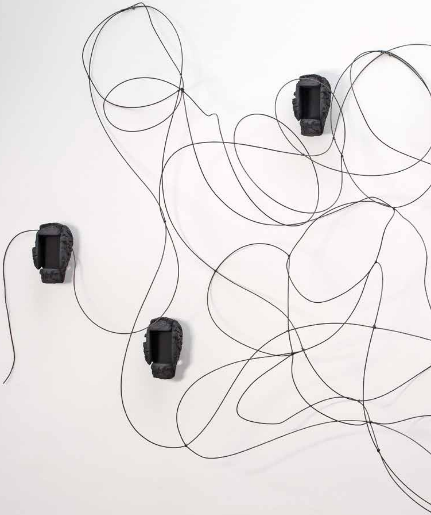
Senza Titolo, Mimmo Paladino, 2013 (Patinated aluminum and iron - 470 x 80 x h 300 cm)