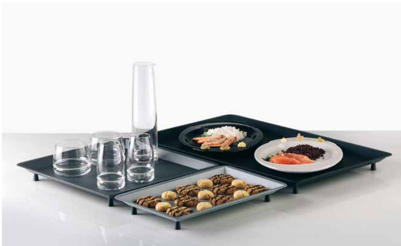
Successo, Enzo Mari 2003 - Photo by Elliott Erwitt

Three different dimensions of containing reissued in a silver finishing. A precious material that Enzo Mari chooses in his research to realize objects with simple and essential shapes, to move away from kitsch interpretations and reproductions of the antique with pure geometries close to industrial forms, almost in contrast with their precious nature.